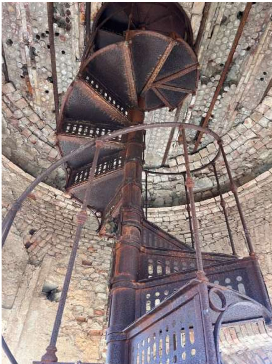
Scala in carpenteria metallica interna alla torre cisterna

Soprintendenza Archeologia, Belle Arti e Paesaggio per le province di Catanzaro e Crotona