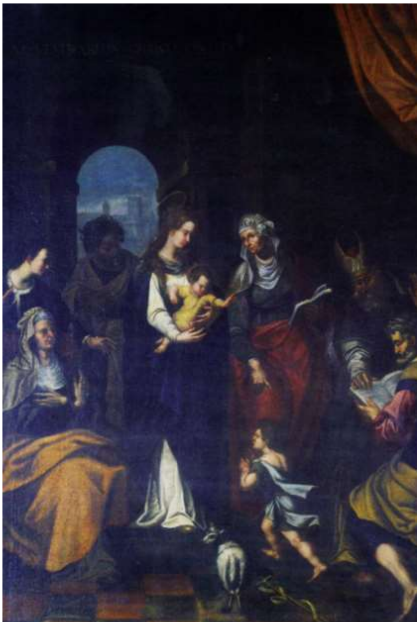
La Sacra Conversazione

Soprintendenza Archeologia, Belle Arti e Paesaggio per le province di Catanzaro e Crotone