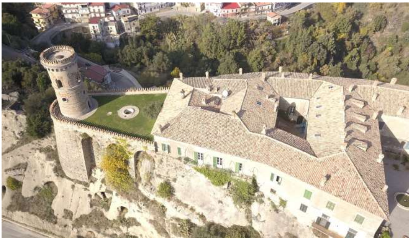
Vista dall'alto del Castello di Caccuri

Soprintendenza Archeologia, Belle Arti e Paesaggio per le province di Catanzaro e Crotone