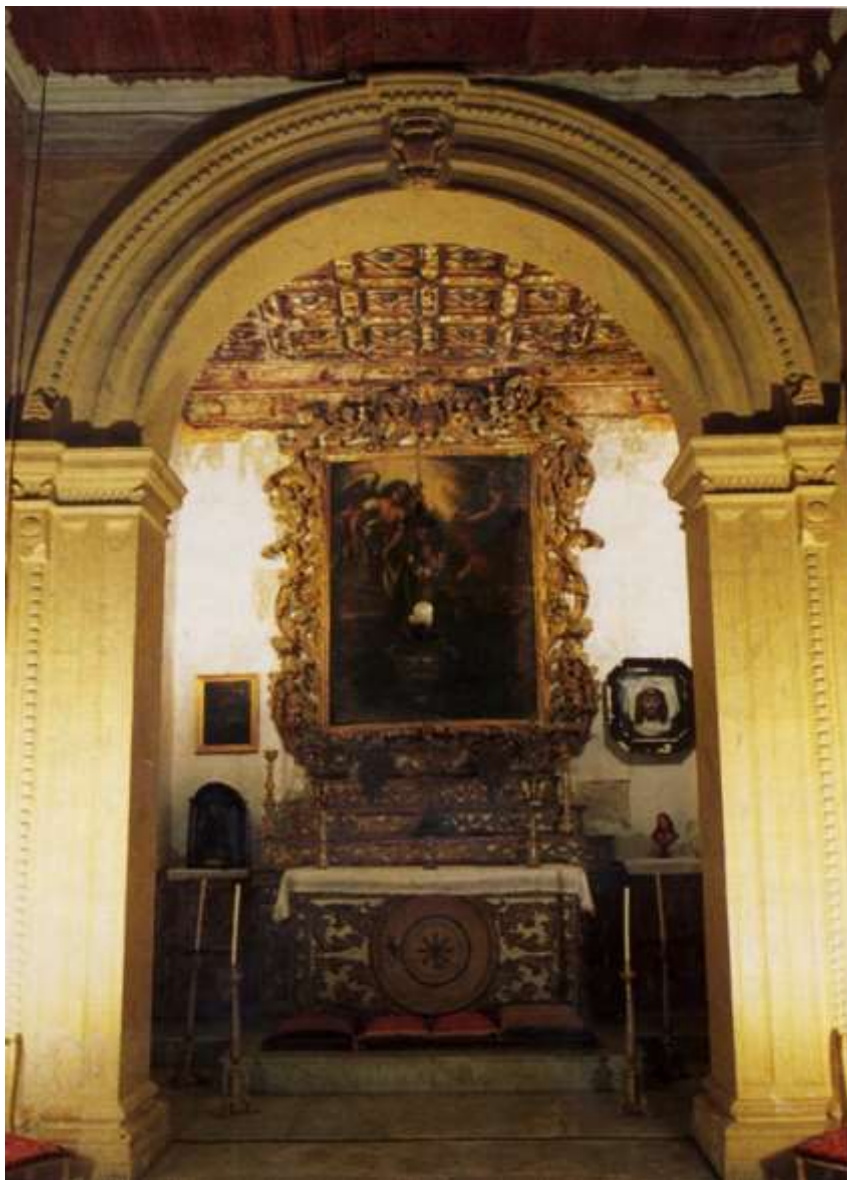
Interno della cappella di Santa Barbara. Altare principale

Soprintendenza Archeologia, Belle Arti e Paesaggio per le province di Catanzaro e Crotone