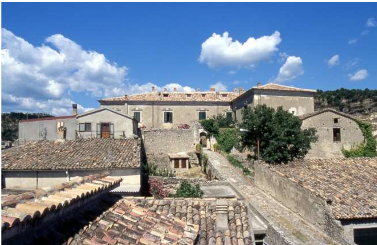
Rampa di accesso al castello lastricata di ciottoli

Soprintendenza Archeologia, Belle Arti e Paesaggio per le province di Catanzaro e Crotona