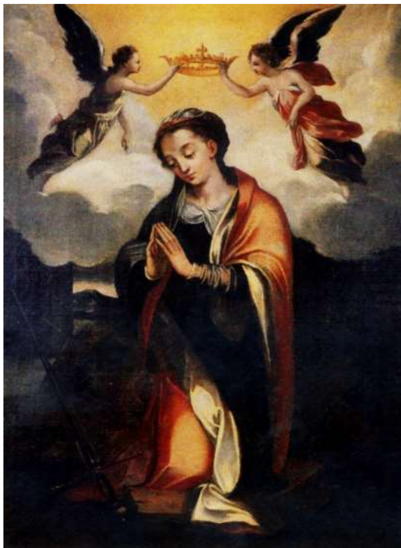
La Santa Caterina d'Alessandria

Soprintendenza Archeologia, Belle Arti e Paesaggio per le province di Catanzaro e Crotone