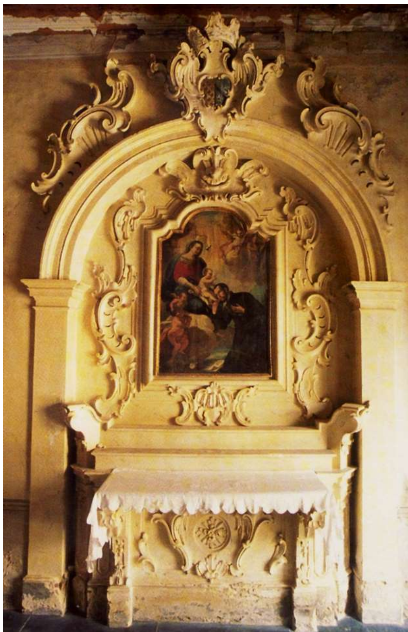
Altare destra. con lo stemma Cavalcanti - Passalacqua

Soprintendenza Archeologia, Belle Arti e Paesaggio per le province di Catanzaro e Crotone