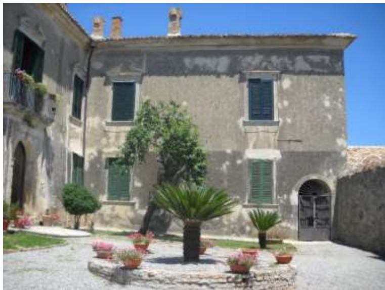
Cortile del Castello e portale litico seicentesco

Soprintendenza Archeologia, Belle Arti e Paesaggio per le province di Catanzaro e Crotone