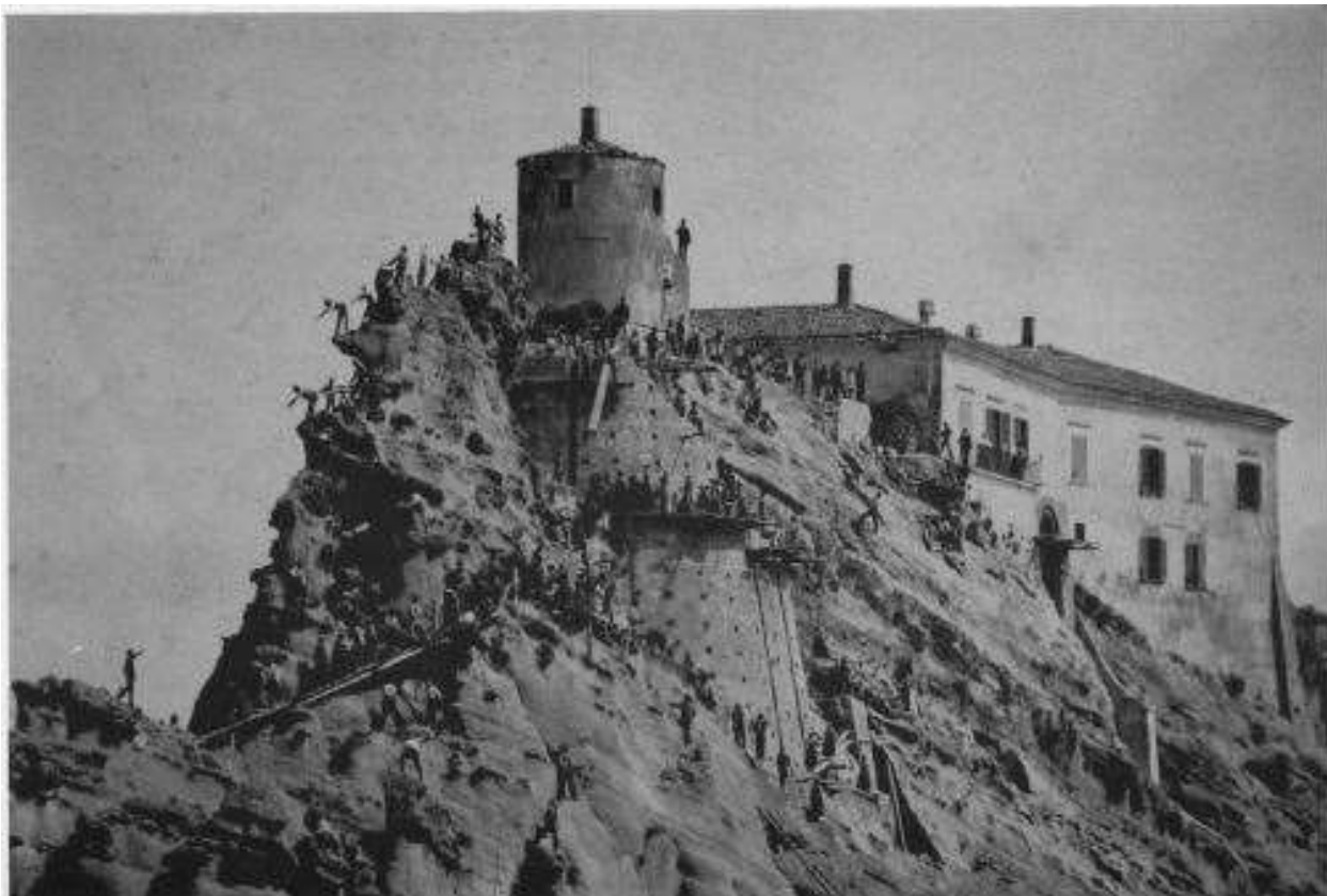
La torre del castello in costruzione, 1885