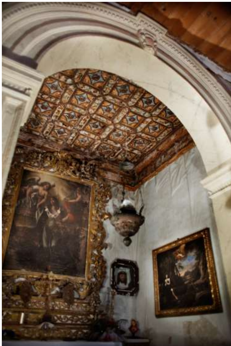
Interno della cappella di Santa Barbara. Altare principale

Soprintendenza Archeologia, Belle Arti e Paesaggio per le province di Catanzaro e Crotone