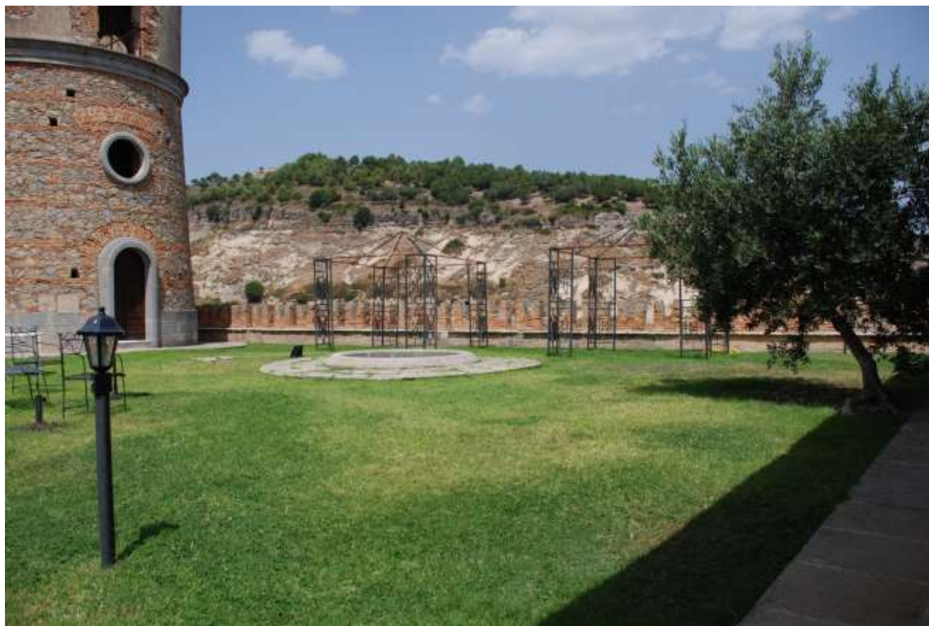
Torre – acquedotto 1885

Soprintendenza Archeologia, Belle Arti e Paesaggio per le province di Catanzaro e Crotona