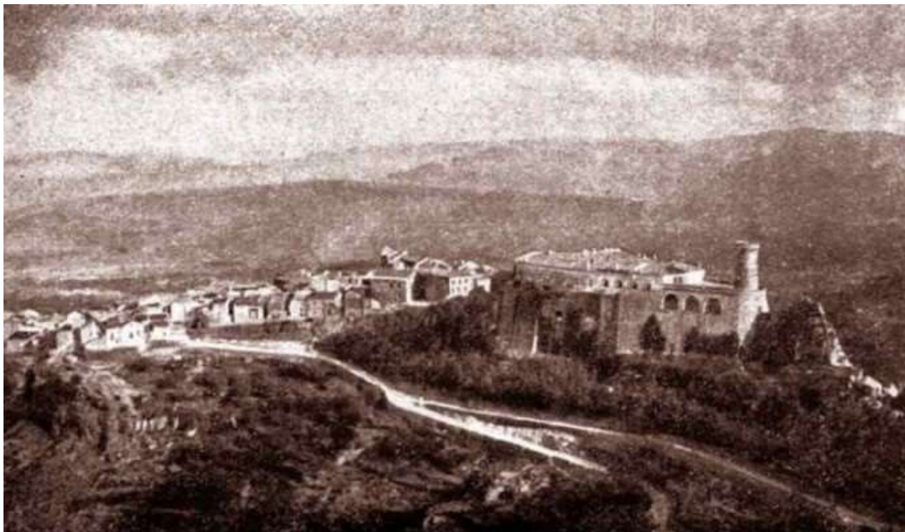
Fotografia del castello e del parco annesso del 1929

Soprintendenza Archeologia, Belle Arti e Paesaggio per le province di Catanzaro e Crotone