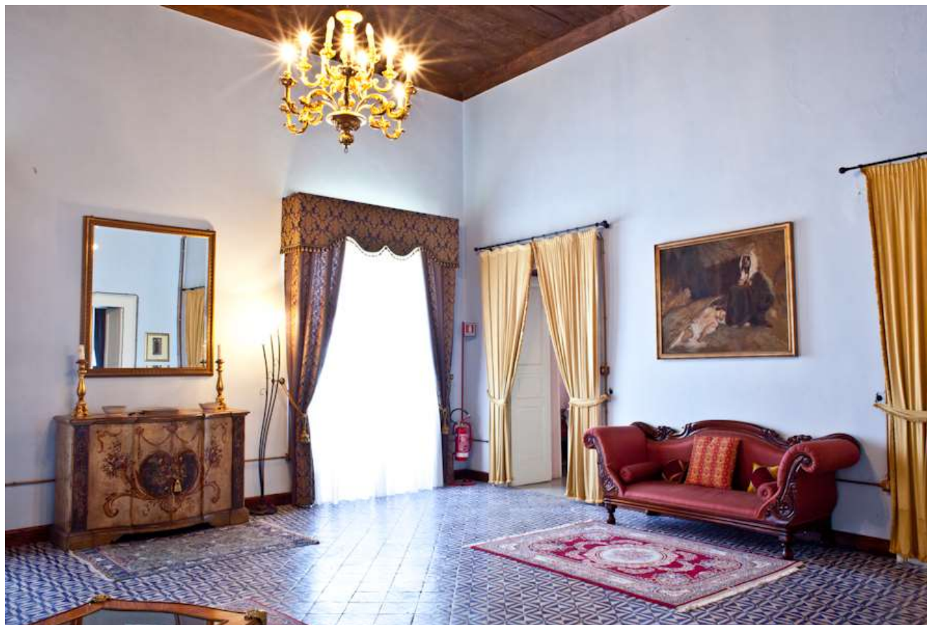
Sale del Castello

Soprintendenza Archeologia, Belle Arti e Paesaggio per le province di Catanzaro e Crotone