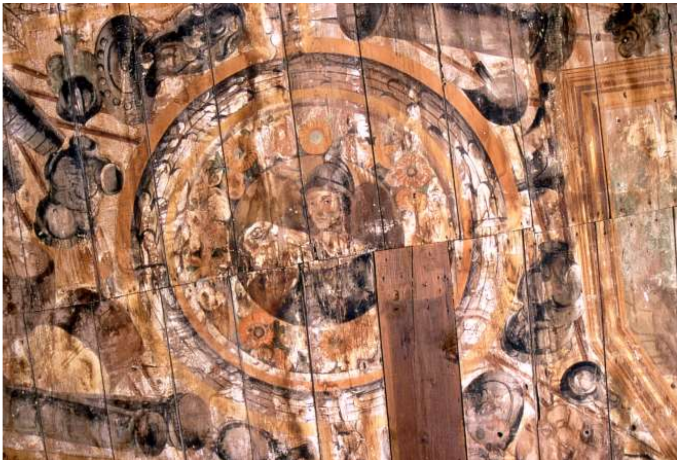
Particolare della Battaglia di Lepanto

Soprintendenza Archeologia, Belle Arti e Paesaggio per le province di Catanzaro e Crotone