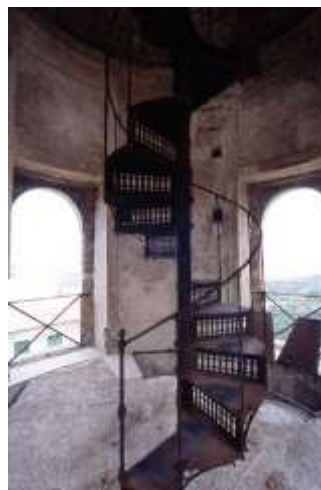
Scala in carpenteria metallica interna alla torre cisterna dettaglio del sistema che la rende retraibile