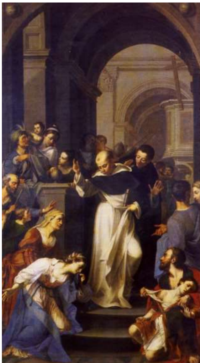
Il San Tommaso d'Aquino che risana un fanciullo

Soprintendenza Archeologia, Belle Arti e Paesaggio per le province di Catanzaro e Crotone