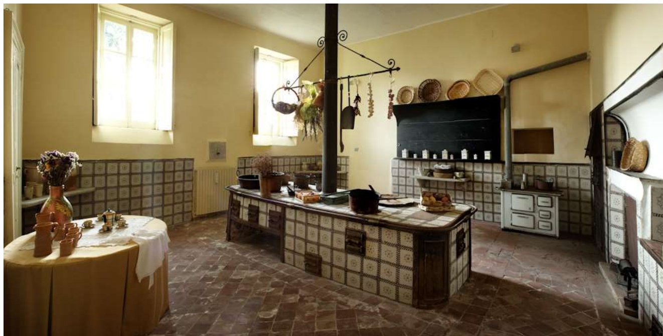
Cucina rivestita in maiolica risalente all' Ottocento

Soprintendenza Archeologia, Belle Arti e Paesaggio per le province di Catanzaro e Crotone