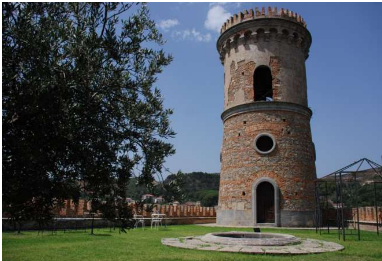
Torre – acquedotto 1885

Soprintendenza Archeologia, Belle Arti e Paesaggio per le province di Catanzaro e Crotone