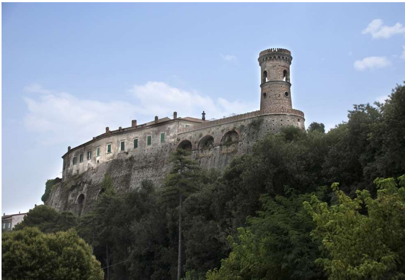
Vista panoramica del Castello in Caccuri

Soprintendenza Archeologia, Belle Arti e Paesaggio per le province di Catanzaro e Crotona