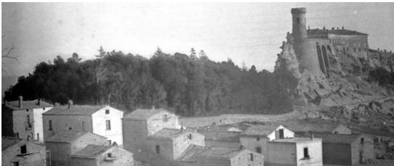
Fotografia del castello e del parco annesso del 1925

Soprintendenza Archeologia, Belle Arti e Paesaggio per le province di Catanzaro e Crotone