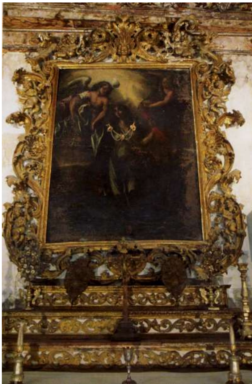
Altare dedicato a Santa Barbara

Soprintendenza Archeologia, Belle Arti e Paesaggio per le province di Catanzaro e Crotone