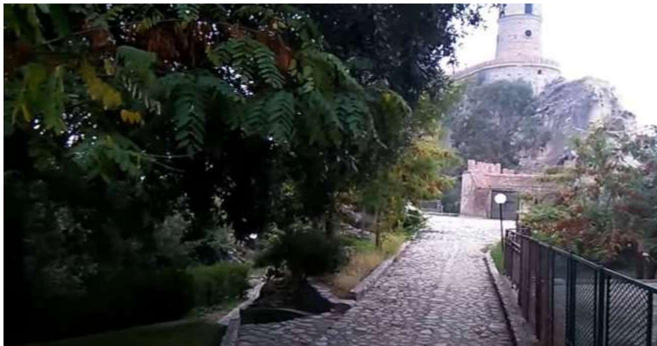
Ex parco del Castello – attuale villa comunale

Soprintendenza Archeologia, Belle Arti e Paesaggio per le province di Catanzaro e Crotona