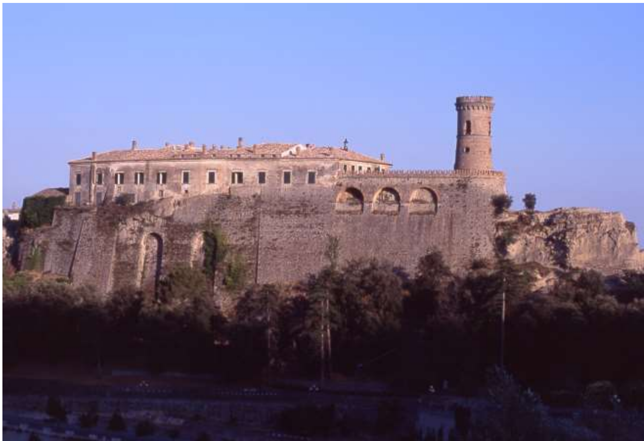
Vista panoramica del Castello in Caccuri

Soprintendenza Archeologia, Belle Arti e Paesaggio per le province di Catanzaro e Crotone