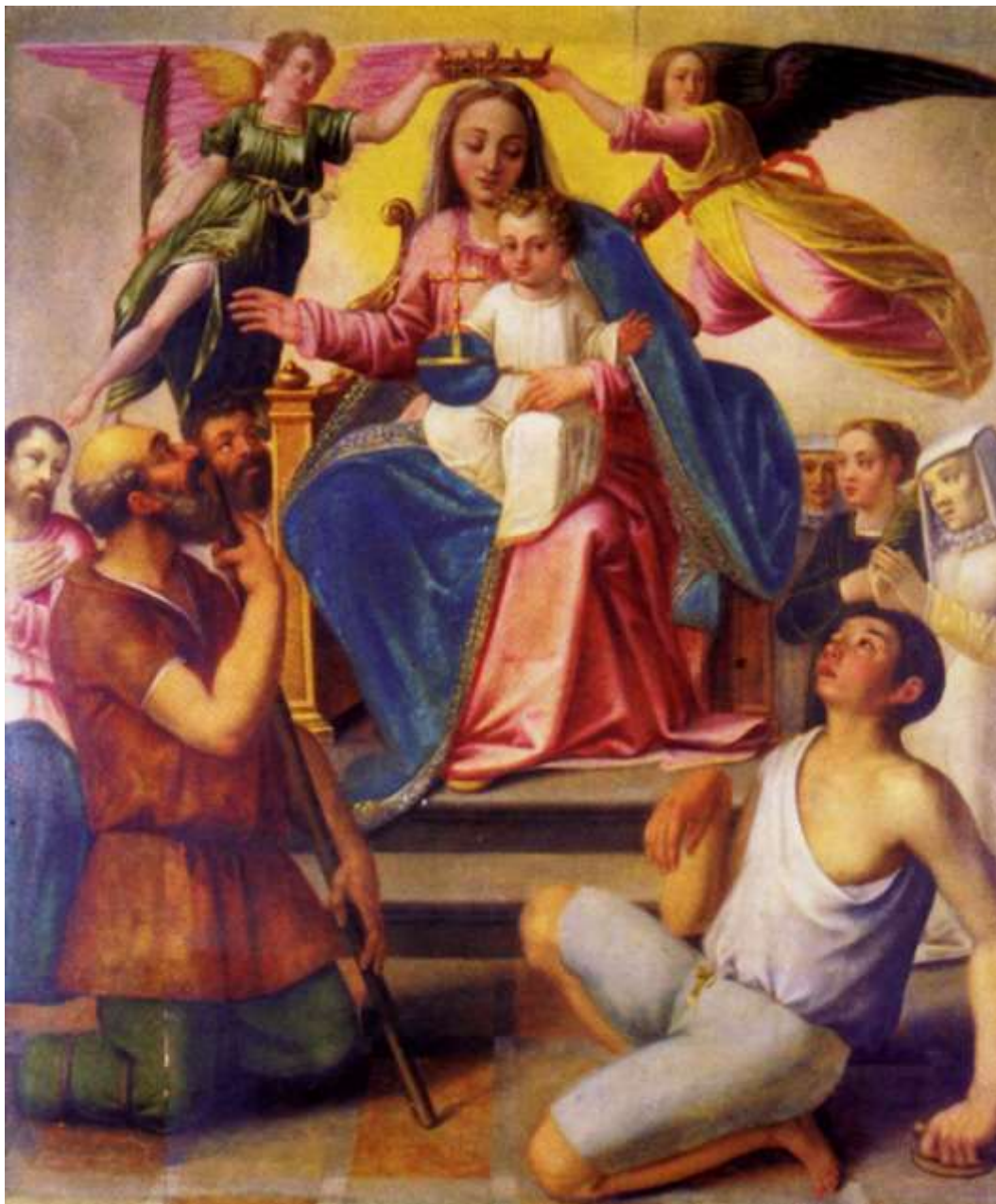
La Madonna con Bambino, infermi e Santa Prudenziana

Soprintendenza Archeologia, Belle Arti e Paesaggio per le province di Catanzaro e Crotone