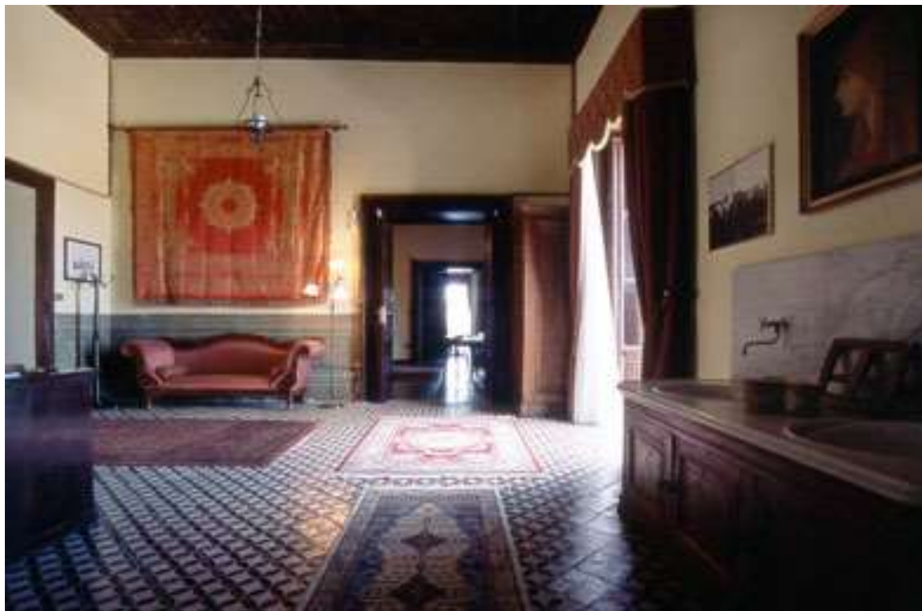
Sale del Castello – sulla destra lavabo basculante

Soprintendenza Archeologia, Belle Arti e Paesaggio per le province di Catanzaro e Crotone