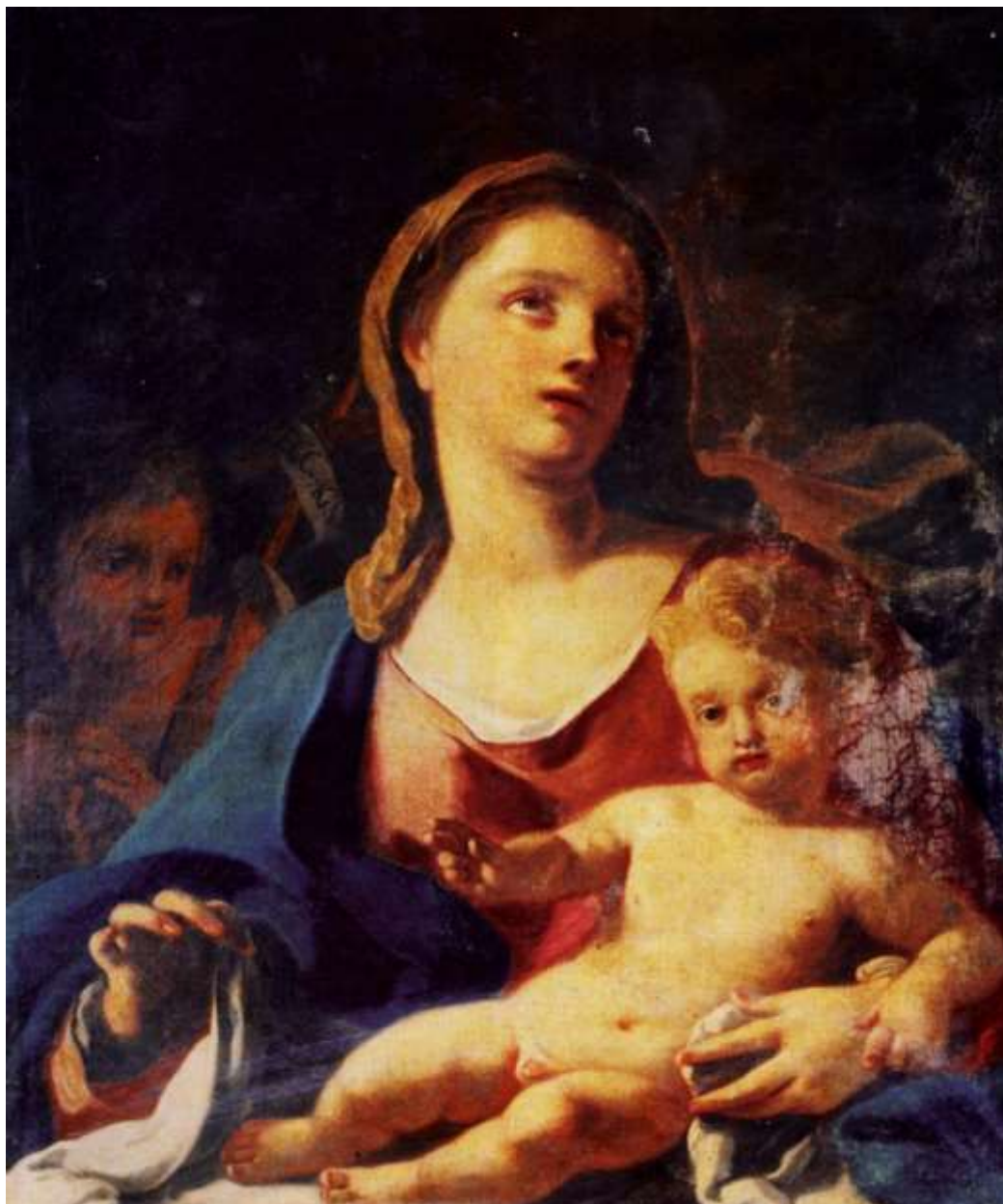
Madonna con Bambino e San Giovannino

Soprintendenza Archeologia, Belle Arti e Paesaggio per le province di Catanzaro e Crotone