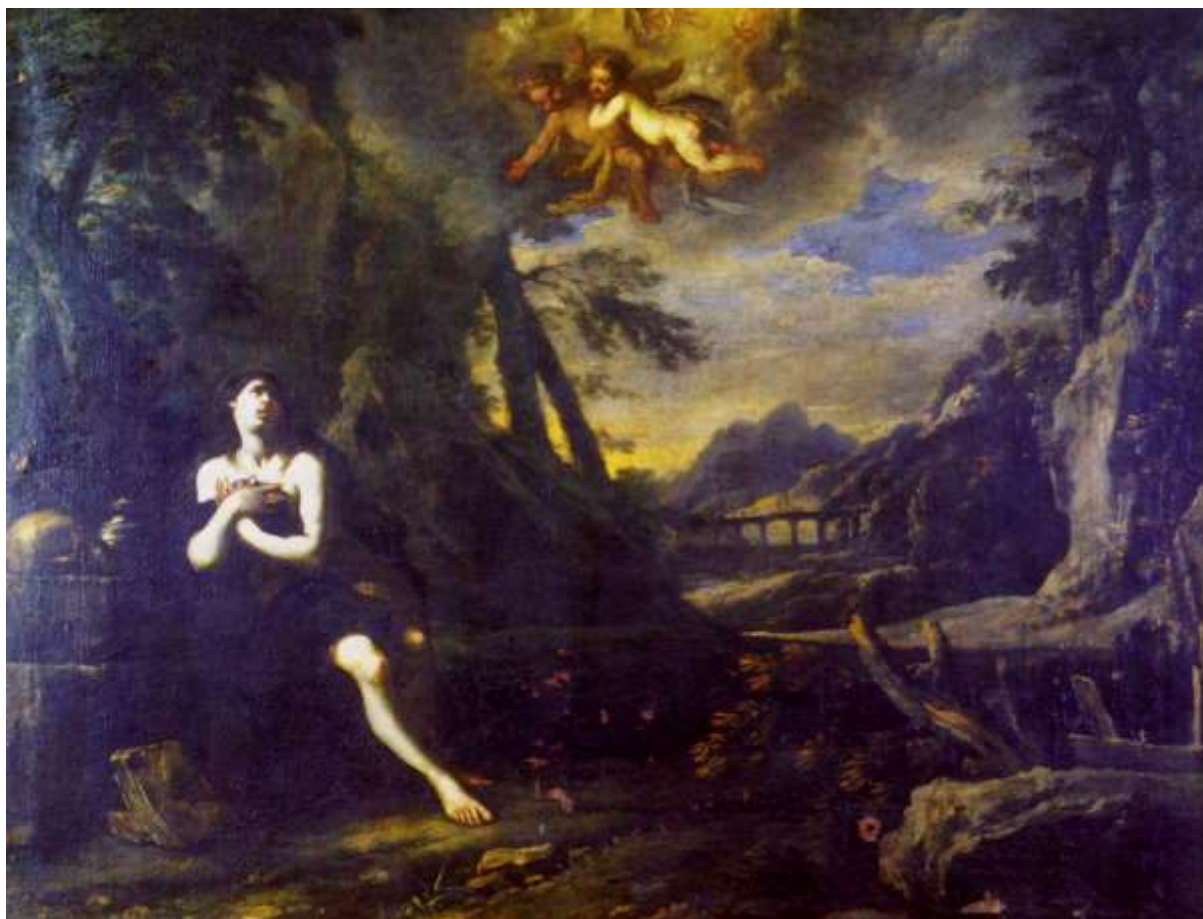
La Maddalena Penitente di Domenico Gargiulo

Soprintendenza Archeologia, Belle Arti e Paesaggio per le province di Catanzaro e Crotona