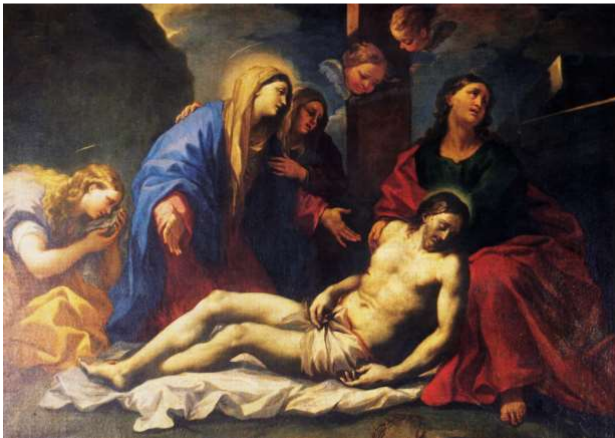
Il Compianto sul Cristo morto

Soprintendenza Archeologia, Belle Arti e Paesaggio per le province di Catanzaro e Crotone