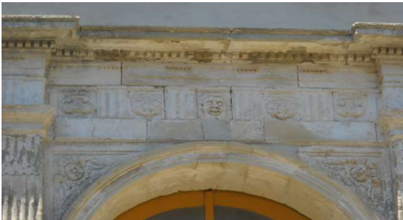
Particolare del fregio del portale d'accesso alla cappella Palatina

Soprintendenza Archeologia, Belle Arti e Paesaggio per le province di Catanzaro e Crotona