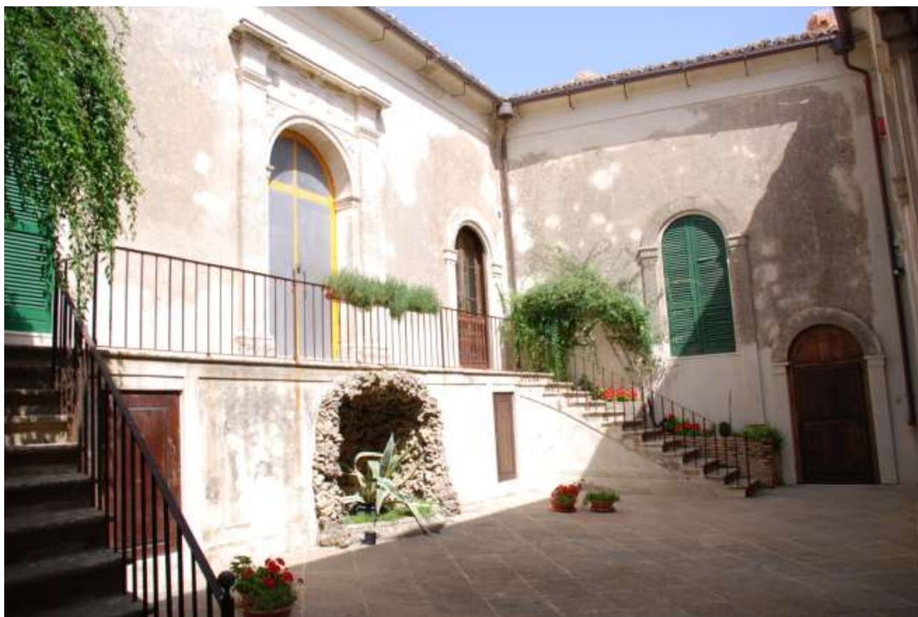
Corte interna. Al centro, il portale d'accesso alla cappella gentilizia

Soprintendenza Archeologia, Belle Arti e Paesaggio per le province di Catanzaro e Crotona