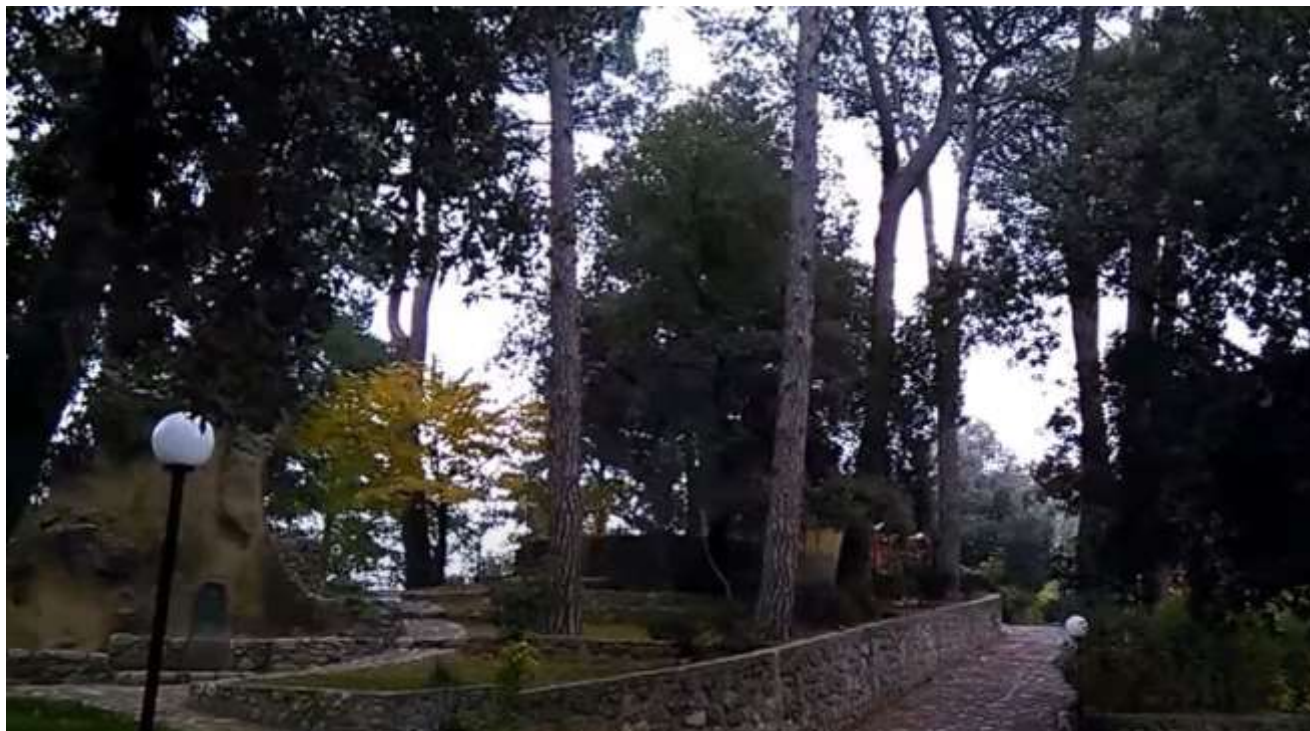
Ex parco del Castello – attuale villa comunale

Soprintendenza Archeologia, Belle Arti e Paesaggio per le province di Catanzaro e Crotona